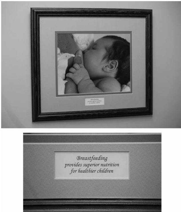
SL. 1. Grafika prijatelja dojenja u obiteljskoj liječničkoj ordinaciji u SAD-u.

održavanje laktacije kada je odvojena od djeteta (npr. tijekom bolesti ili povratka na posao), dojenje u javnosti, poslijeporođajna depresija, korištenje lijekova i majčina bolest tijekom dojenja.(I)